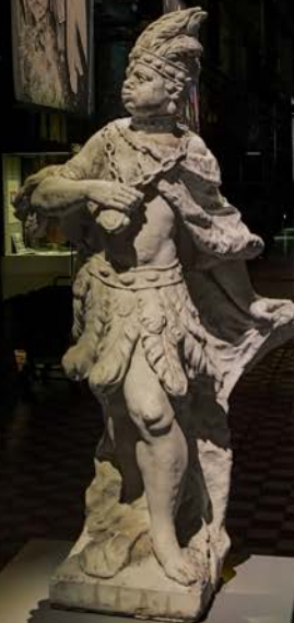
Wellness! Adam Faithful's 1781 Africa