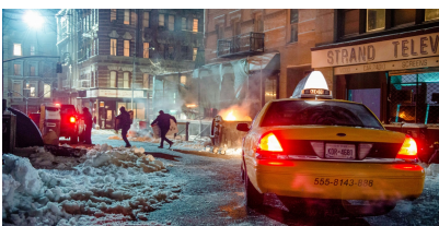
Julian Rosefeldt: EUPHORIA, 2022