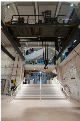
Eingangshalle im Wasserhochbehälter