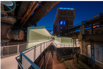
Der neue Verbindungssteg zwischen Pumpenhaus und Gebläsehalle mit der Silhouette des Wasserhochbehälters, zur blauen Stunde, bei Einbruch der Dunkelheit