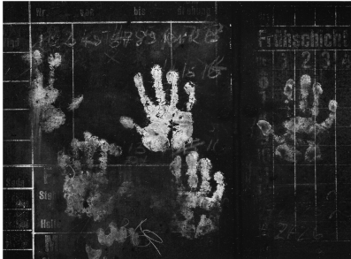
Dieter Walter: Kreide-Handabdrücke auf einer Schichttafel in der Gebläsehalle, 1988