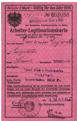
Arbeiterlegitimationskarte eines russischen Zwangsarbeiters, 1916